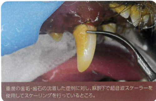
重度の歯垢・歯石の沈着した症例に対し、麻酔下で超音波スケーラーを使用してスケーリングを行っているところ。

病院内では、沈着してしまった歯垢や歯石をスケーリング、ポリッシングして、キレイにすることができます。