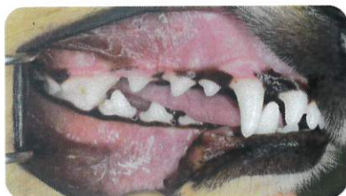
症例：1歳齢 雌のダックスフンド