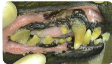
症例：9歳齢 雌のダックスフンド