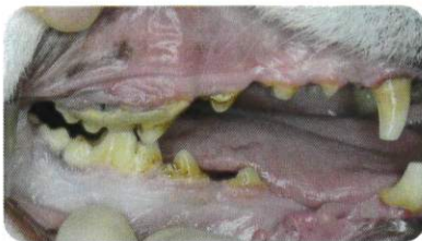
症例：9歳齢 避妊雌の雑種